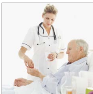
Distribution des médicaments