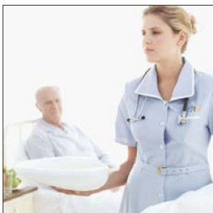
Suivi des selles