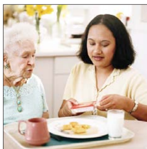
Suivi alimentaire et hydrique